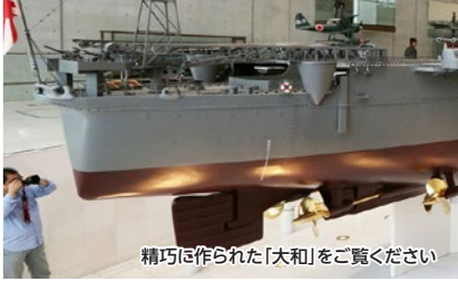
精巧に作られた「大和」をご覧ください